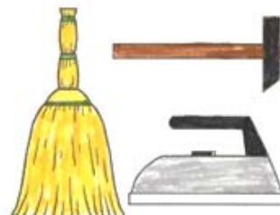
6. Занятия членов семьи

Дети четырех-пяти лет очень пытливы, они задают много вопросов, им интересны качества и свойства предметов, они могут установить простейшие связи между явлениями природы.