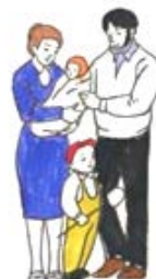
5. С кем я живу, за что люблю своих близких