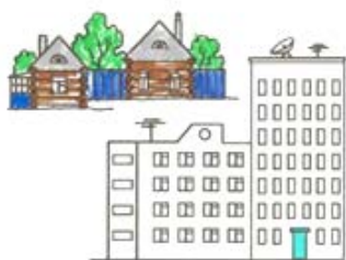
4. Адрес (город/деревня, улица, дом) и описание дома