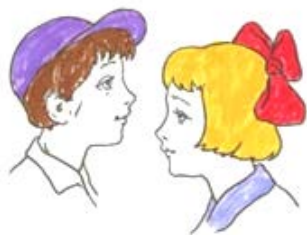
1. Пол, имя (из каких деталей или частей состоит)