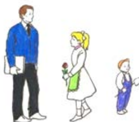
2. Рост (высокий, средний, маленький) и возраст